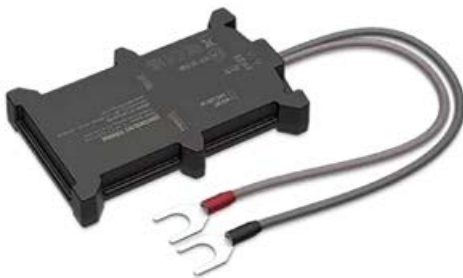
Festeinbau Datenlogger TRV100