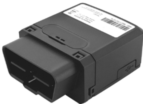
OBD Datenlogger TRV500

Das Euro-Fahrtenbuch GPS V2.0 ist ein elektronisches Fahrtenbuchsystem für Microsoft Windows Computer. Es wird zusammen mit einem OBD oder einem Festeinbau GPS Datenlogger geliefert. Der OBD Datenlogger TRV500 wird ohne Einbaukosten einfach in die OBD Diagnosebuchse des Fahrzeuges eingesteckt und zeichnet fortan alle Fahrzeugbewegungen auf. Der Datenlogger für den Festeinbau vom Typ TRV100 wird auf die Starterbatterie geklebt und mit den beiden Polen der Batterie verbunden.